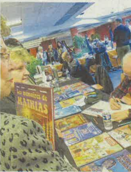
Le Salon sera au cœur de l'actualité